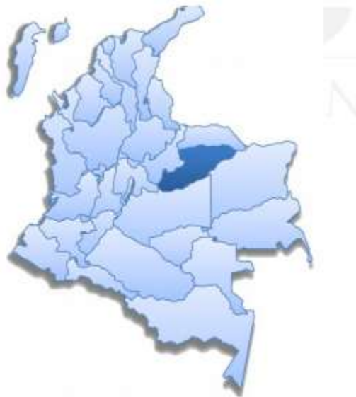
Figura 1. Ubicación de Casanare dentro de Colombia

El criterio de escogencia de estos municipios obedece a un parámetro y es el nivel de desarrollo que estos puedan tener, desarrollo que se agrupa en tres categorías: Alto, medio o bajo; en donde tres municipios se eligieron por categoría para completar los nueve planteados. Constituyendo de esta manera la siguiente elección: Yopal, Aguazul y Sabanalarga (alto); Maní, Paz de Ariporo y Villanueva (mediano) y Támara, Hato Corozal y Nunchía para bajo desarrollo. Un referente que se consultó