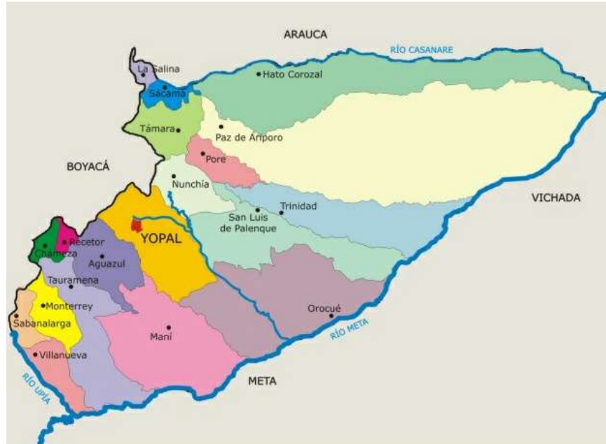
Figura 2. Mapa político de Casanare

Siendo Casanare uno de los Departamentos de mayor extensión de Colombia, conformado como se mencionaba por 19 municipios, es un Departamento que presenta una geografía de montañas, llanuras, cerros, serranías, bosques, ríos, caños y quebradas que conforman sus paisajes. Tradicionalmente Casanare de acuerdo a la zonificación en tres regiones Norte, Centro y Sur, ha recibido así mismo, todo el enfoque institucional el cual se ha manejado direccionado en zonales y subregionales que generalmente tienen como epicentros Paz de Ariporo para el Norte, Yopal para el Centro y Villanueva para el Sur. Encontrándose agrupados la totalidad de los municipios en la subdivisión de la siguiente manera: Norte (La Salina, Sácama, Hato Corozal, Paz de Ariporo, Pore, Trinidad, Támara y San Luis de Palenque); Centro (Aguazul, Recetor, Nunchía, Maní y Yopal) y en el Sur (Monterrey, Sabanalarga, Tauramena y Villanueva). Indudablemente por las interrelaciones que se desarrollan entre estos se podrá evidenciar como unos municipios se articulan unos con otros para su desarrollo.