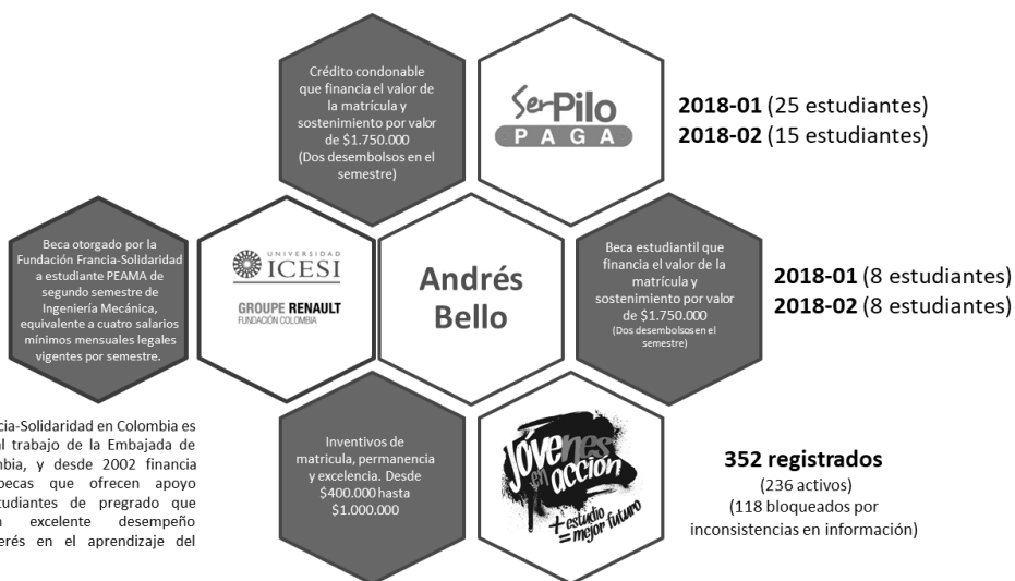
ILUSTRACIÓN 1. ENTIDADES DE APOYO

La Fundación Francia-Solidaridad en Colombia es una ONG ligada al trabajo de la Embajada de Francia en Colombia, y desde 2002 financia programas de becas que ofrecen apoyo económico a estudiantes de pregrado que demuestren un excelente desempeño académico e interés en el aprendizaje del francés.